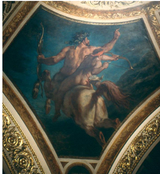
L'Education d'Achille coupole de la Poésie