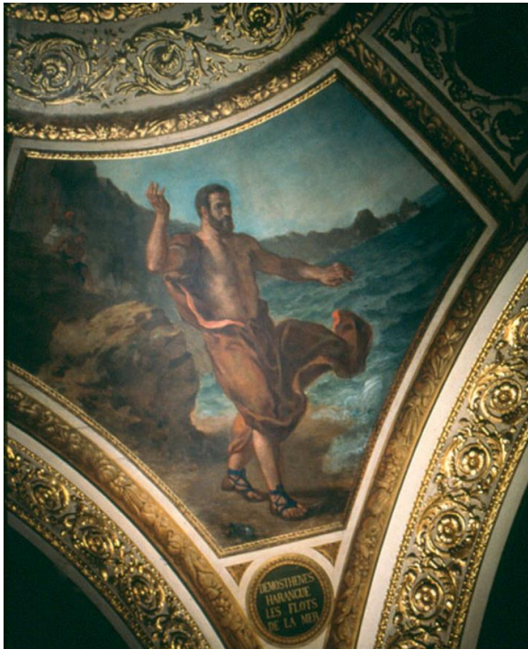
Demosthène harangue la mer coupole du Droit