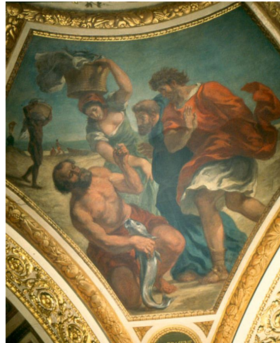
Le Tribut (Theologie)