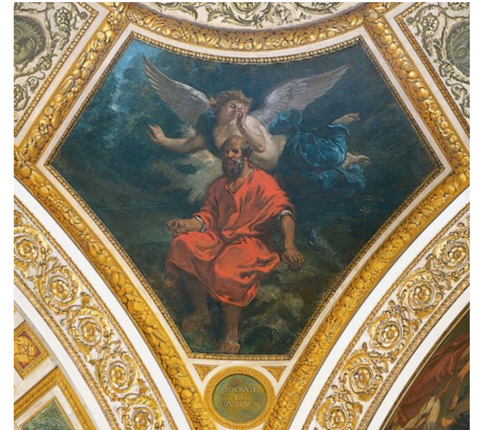
Socrate et son démon (Philosophie)