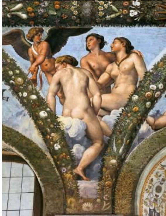
Raphael à la Farnesina