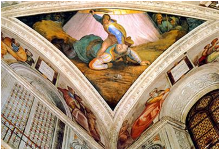
Michel Ange à la Chapelle Sixtine