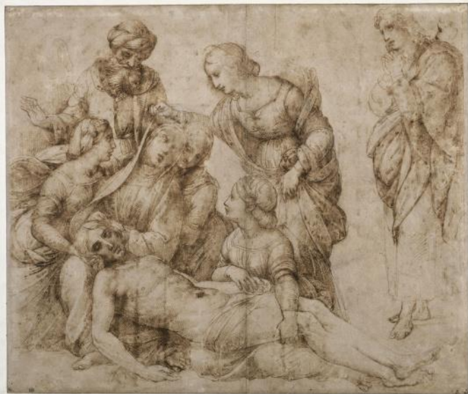
Dessin de Raphael